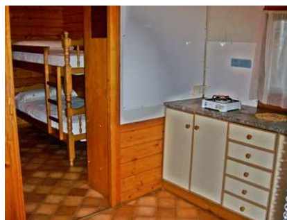
Vue de la cuisine