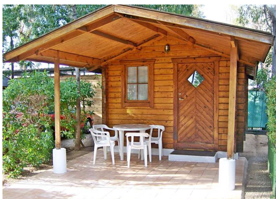
Vue de l'extérieur