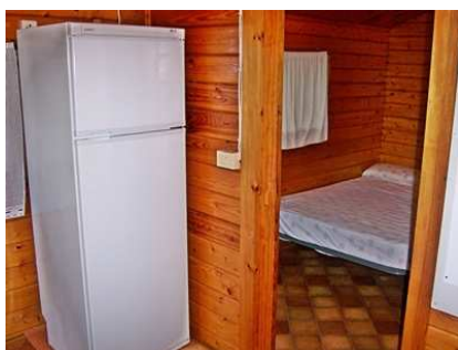
Vue de la cuisine