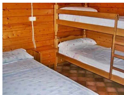
Vue de la chambre avec grand lit