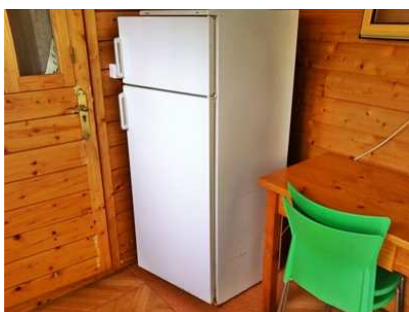
Vue de la cuisine