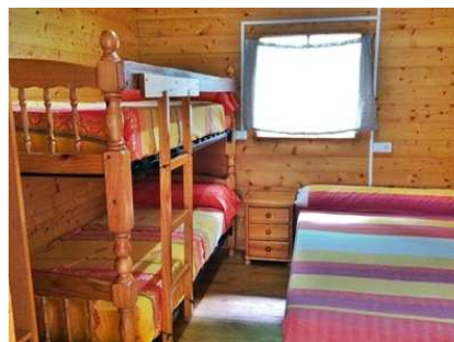
Vue de la chambre avec grand lit