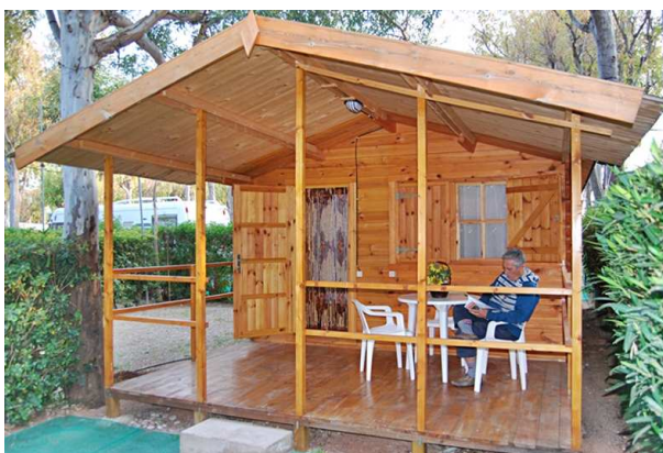
Vue de l'extérieur