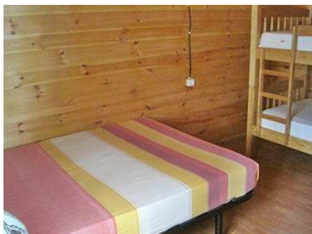
Vue de la chambre avec grand lit