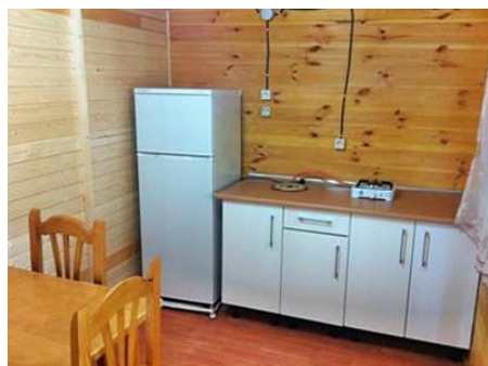
Vue de la cuisine