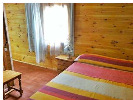
Vue de la chambre avec grand lit