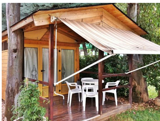
Vue de l'extérieur