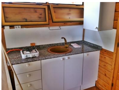
Vue de la cuisine avec évier