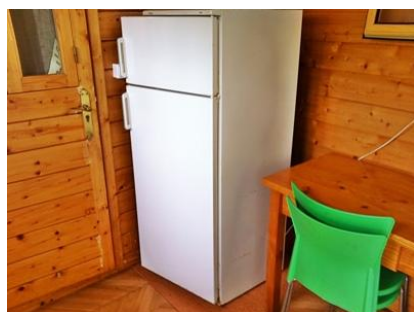
Vue de la cuisine