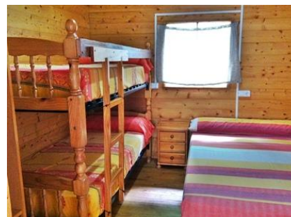
Vue de la chambre avec grand lit